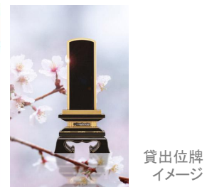
貸出位牌イメージ